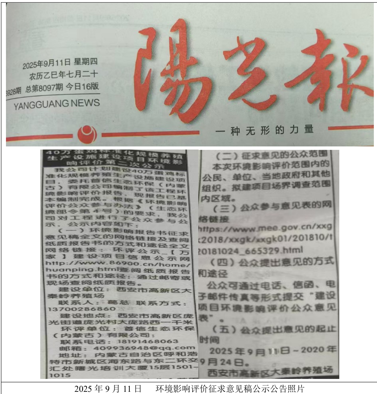
2025 年 9 月 11 日 环境影响评价征求意见稿公示公告照片 图 3 本工程环境影响评价征求意见稿报纸公示公告照片