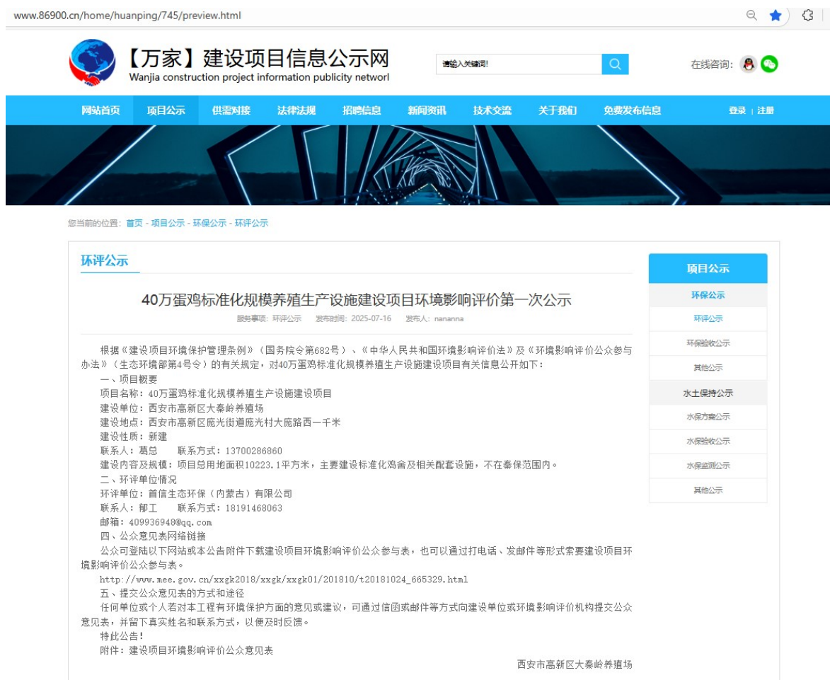
图 1 本工程环境影响评价信息的网络公告（一次公示）